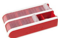
Liten, röd Art.Nr. 120045