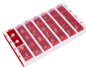
Stor, röd Art.Nr. 120055

Schine Pill Box är en förvaringsask för mediciner. Asken är klassad som medicinteknisk produkt klass I.