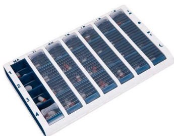
Stor, blå Art.Nr. 120050